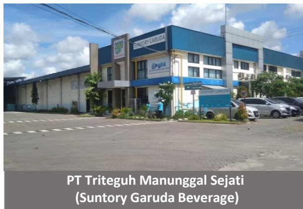
PT Tritегuh Manunggal Sejati (Suntory Garuda Beverage)