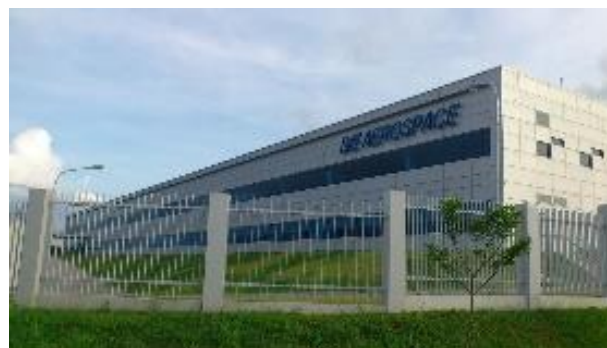
エアロスペース社