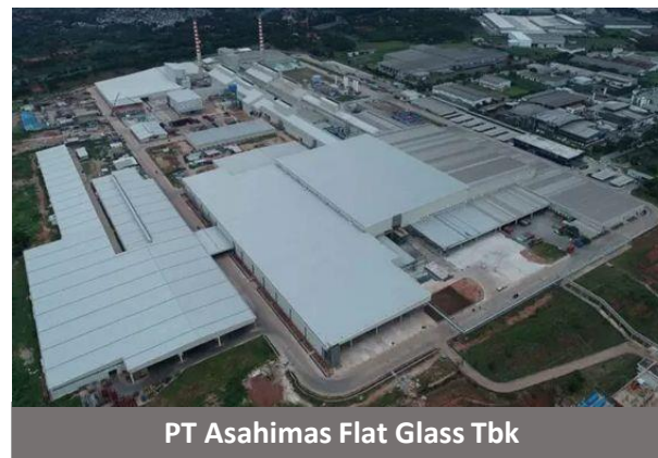
PT Asahimas Flat Glass Tbk