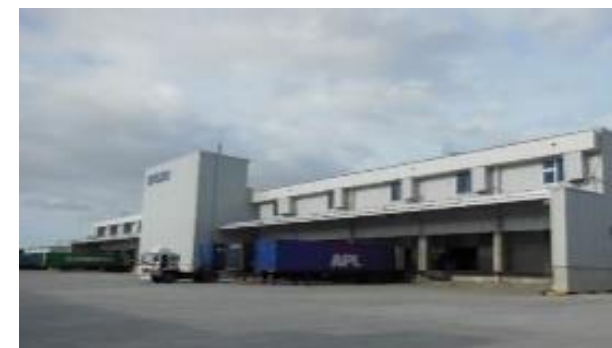
セイコーエプソン 株式会社