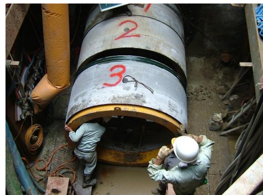
台湾電力地中線工事