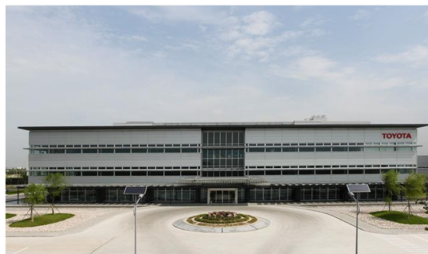
トヨタ自動車株式会社 研究開発センター