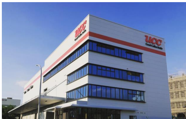
優仕咖啡股份有限公司