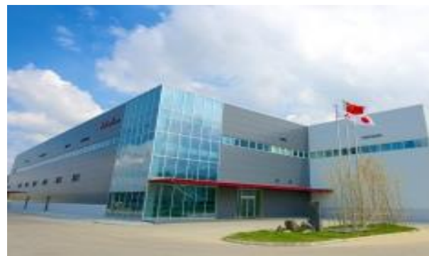
三菱ケミカル株式会社