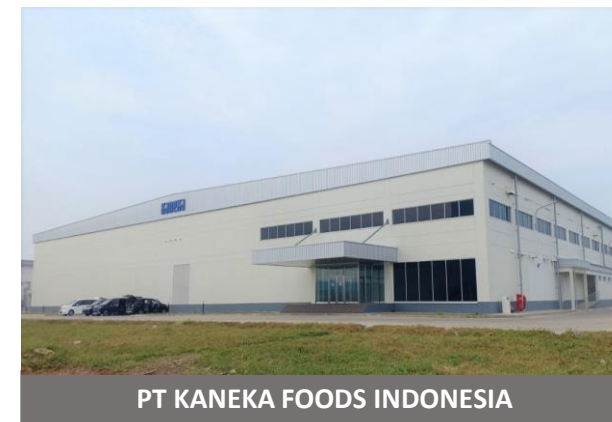
PT KANEKA FOODS INDONESIA