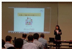
▲介護セミナーでは、本人および職場の仲間が介護に直面した際に仕事との両立ができるよう、介護に関する基礎知識や支援制度について説明しました。

また、介護セミナーを開催し、従業員の介護に関する知識の習得や意識啓発を図りました。さらに、介護に関する情報をまとめたハンドブックやリーフレットを作成し、情報を発信しています。