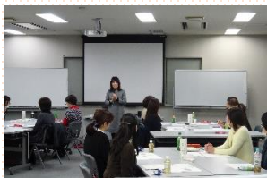
▲女性社員に向けた研修では、自分のキャリアや可能性について考えるグループワークを行いました。

さらに、平成28年度は女性の職域拡大施策のひとつとして、業務での接点が少ない女性技術者同士の「つながり」をつくることを目的に、女性技術者交流会を開催しました。