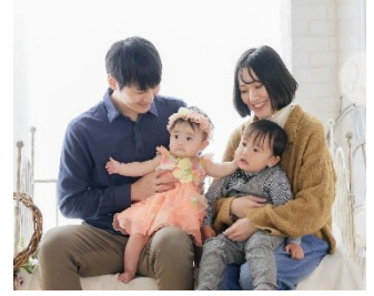
中部本部 内線部 工事第一グループ D.K.

妻と相談して、2人目の出産時に約半年間の育休を取得しました。1人目の時はあまり家族と一緒にいる時間を作れなかったのが、今回の育休取得で日々充実した日を送れました。改めて子供と過ごす時間のかけがえのなさを実感しました。これからもその時間を大切にしていきたいです。