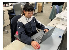
情報通信部 ICTネットワーク第二グループ M.K

「今」自分ができるととにかく全力で取り組んでください。その積み重ねが自分の経験につながります。