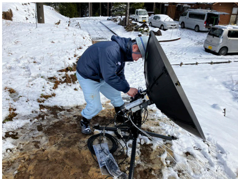
通信設備復旧作業の様子