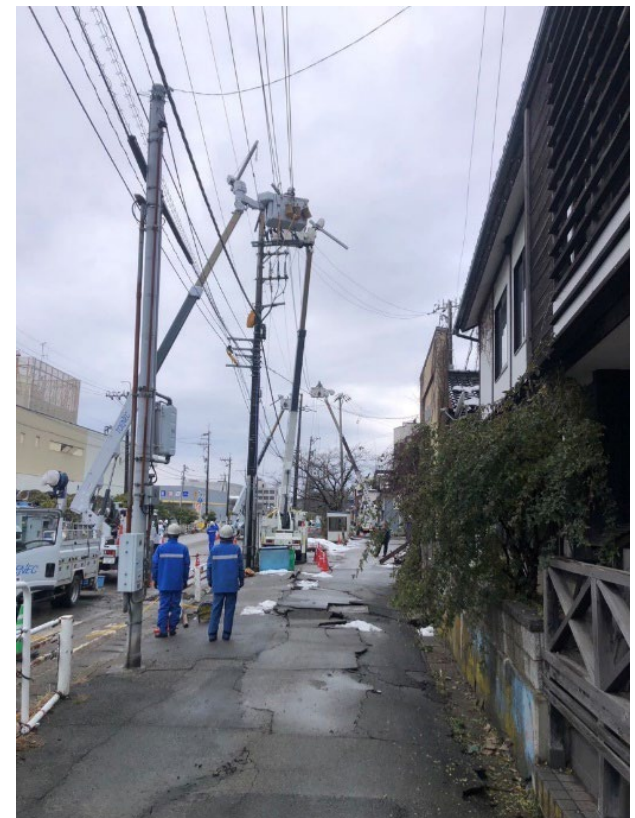
配電設備復旧作業の様子