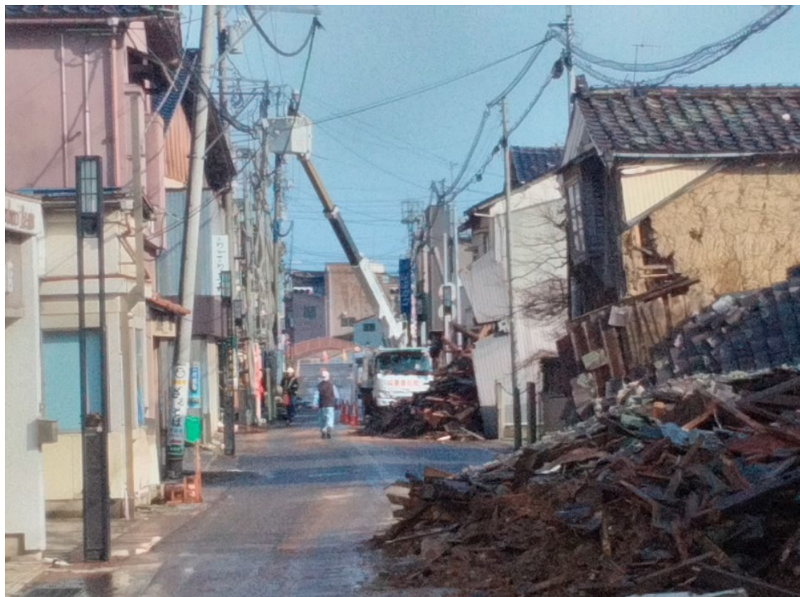
配電設備復旧作業の様子